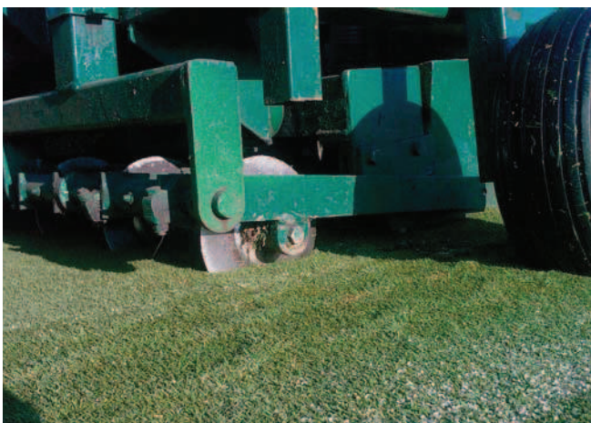
Die Arbeiten optimieren die Wasserdurchlässigkeit des Grüns.

Vielen Dank für das Interview Herr Hennewig.